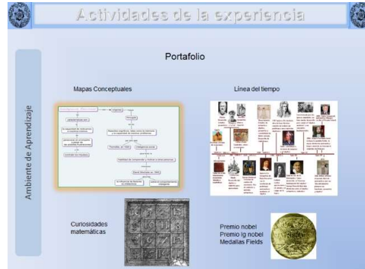
Figura 3: Actividades desarrolladas