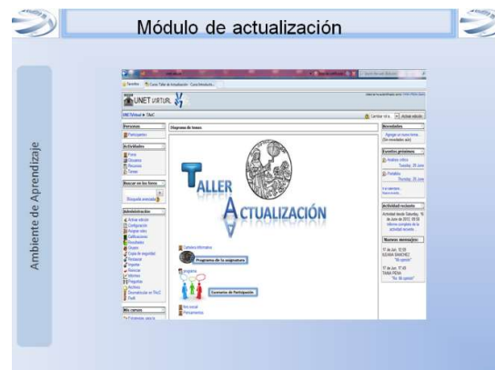
Figura 1: Bloque de Bienvenida y foros de Intercambio social

La plataforma virtual donde se realizó la experiencia de aprendizaje estaba conformada por: Foros sociales y de conocimiento; Bloques de conocimiento específicos y actividades de evaluación