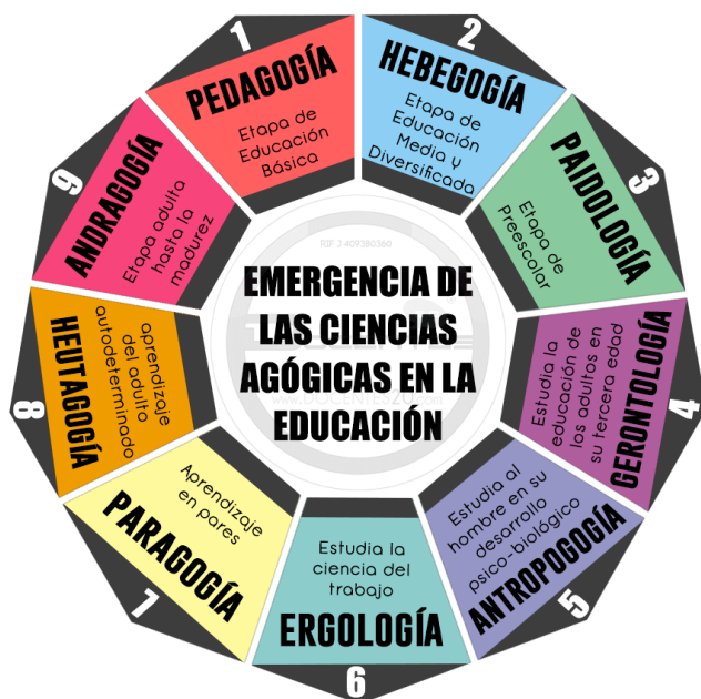
Figura 1 Emergencia de las Ciencias Agógicas en la Educación

Nota. Se puede apreciar que el aprendizaje ha recorrido un largo camino de innovación y transformación, lo cual invita a los docentes estar actualizado para un pertinente uso en la educación digital, elaborado por Mujica-Sequera (2022)