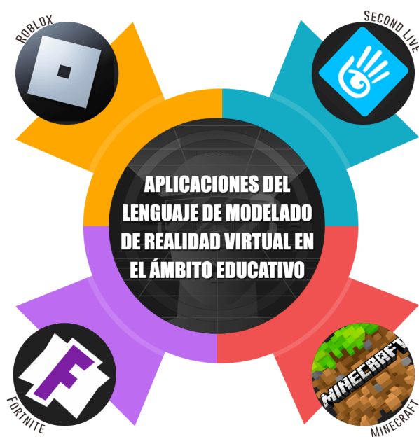
Figura 3 Aplicaciones del Lenguaje de Modelado de Realidad Virtual en el Ámbito Educativo

Nota. Estas son lagunas de las aplicaciones utilizadas en el ámbito educativo, elaborado por Mujica-Sequera (2022).